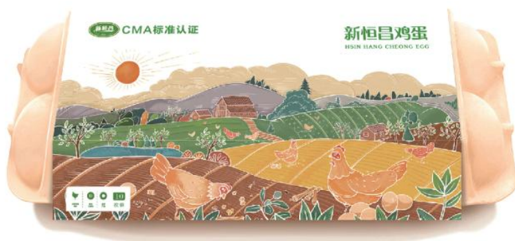
新恒昌鸡蛋 包装效果图