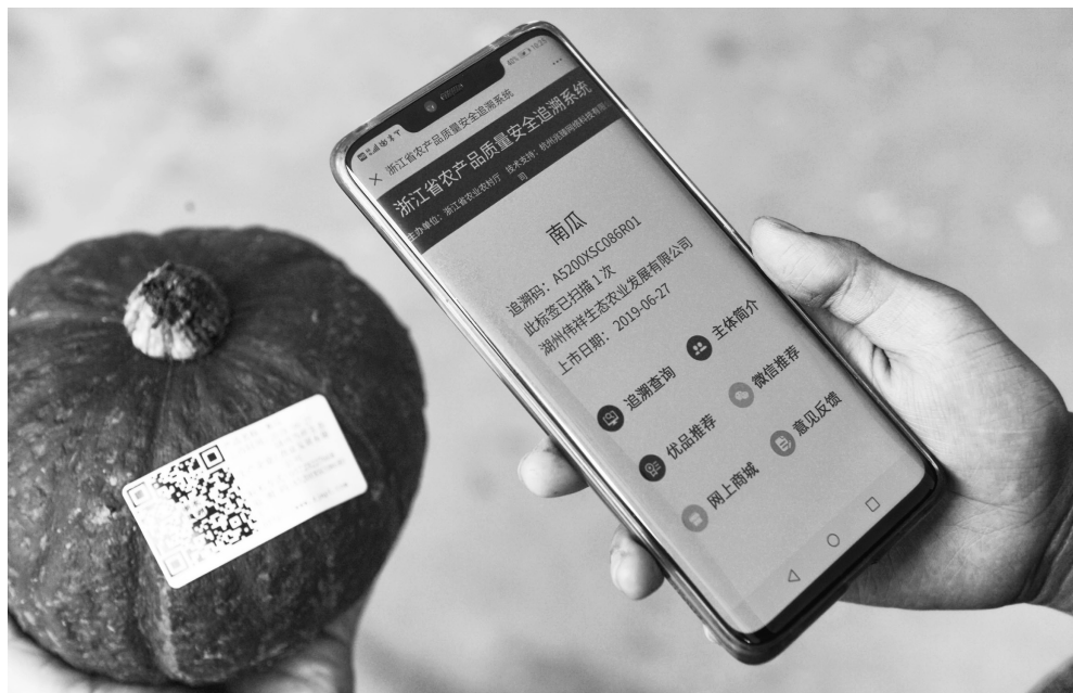
以食用农产品质量安全追溯制度，让人民群众吃上更多有“身份证”的安全食物

二是抓好产地环境保护。产地环境是安全优质农产品生产的基础条件。新修订的农产品质量安全法，对产地环境做了全面的规定，包括建立健全农产品产地监测制度，加强产地安全调查、监测和评价；与