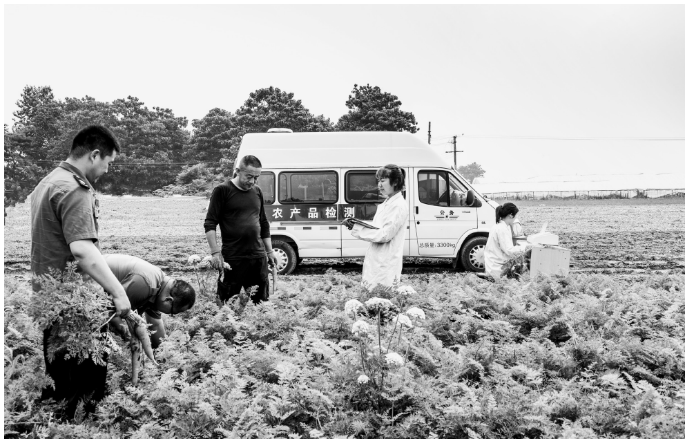
加强市、县农业执法人员队伍建设,提升执法手段,规范执法行为

立法调研和政府规章的起草工作,或者尽快出台指导性意见,为各地监管工作提供指导性原则和监管依据。四是要依法落实条件保障,落实网格化管理要求,加强监管能力建设,在“人、财、物”保障上要舍得投入。五是要紧紧抓住以政府名义开展的农产品质量安全示范创建,用好考核“指挥棒”、党政主要领导年度专项述职等硬手段,推