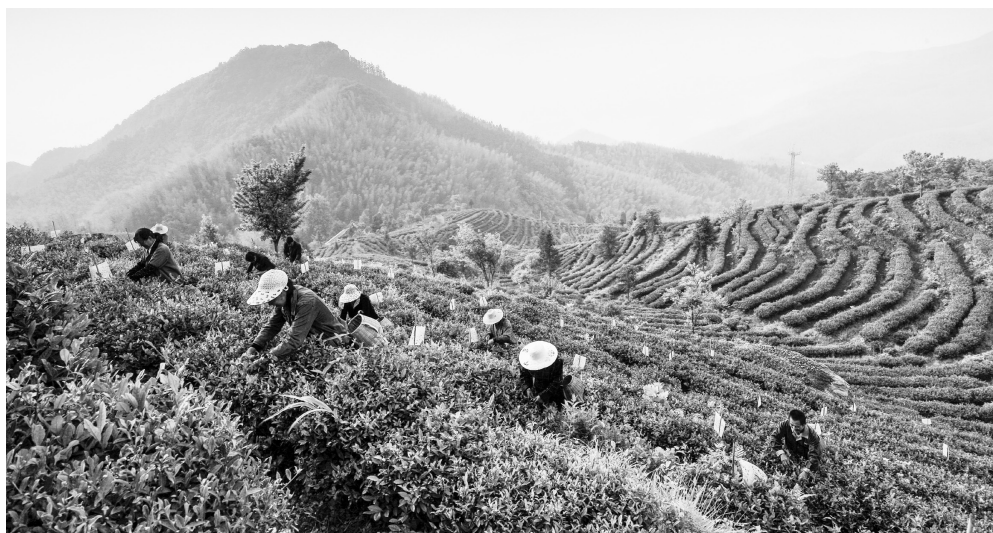
加强农产品质量安全工作，构建协同、高效的社会共治体系

学、严格的监督管理制度，构建协同、高效的社会共治体系”。依法推动构建企业自治、行业自律、社会监督、政府监管等相结合的社会共治新机制，是提高农产品质量安全水平的