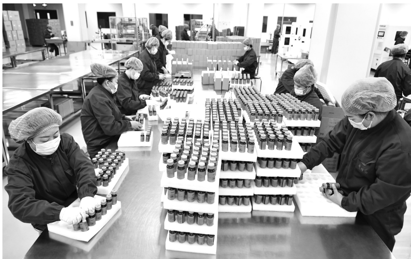
坚持绿色有机地标农产品精品品牌定位，培育龙头企业，发展优质农产品

把好质量关口，着力增加绿色优质农产品供给。严格绿色有机地标农产品审查认证登记，坚持从严从紧，严谨执行标准，严格履程序，严肃落实责任。全面落实各项证后监管制度，压紧压实各级工作机构监管职责，确保产品质量稳定可靠，标志使用规范。以优化结构、做强主体为导向，推动农业产业化龙头企业、大型食品企业、农民专业合作社示范社发展绿色食品，加快推进畜禽、水产和