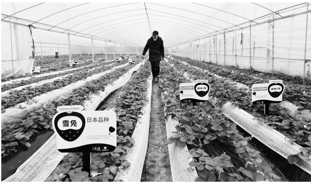
科学合理使用农业投入品，保障安全优质农产品的生产

2018年，我国专门出台了土壤污染防治法，对规划、标准、普查和监测、预防和保护、风险管控和修复等作了全面规定。新法与土壤污染防治法相衔接，一方面，规定国家建立农产品产地监测制度，优化农产品产地环境调查、监测和评价工作，依照土壤污染防治等法律法规，划定特定农产品禁止生产区域。在摸清现状和底数的基础上，科学利用与修复污染地块，加强对