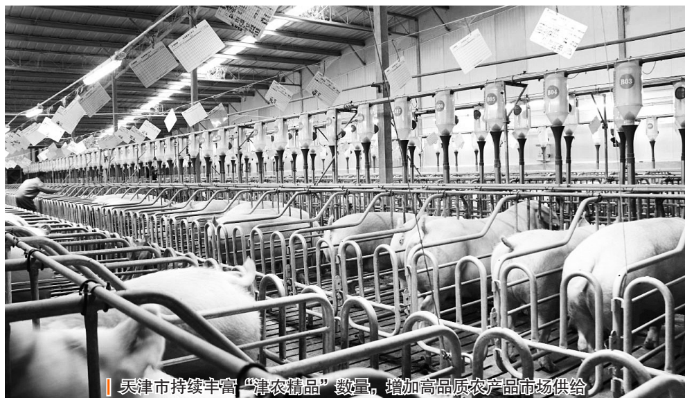
天津市持续丰富“津农精品”数量，增加高品质农产品市场供给

深入推进品牌打造工程。建立优质农产品生产基地目录，强化优质农产品全程质量控制监管，增加天津市绿色、有机和地理标志农产品认证数量，加强品牌培育，丰富“津农精品”数量，不断提升产品的知名度和美誉度，在实现农民增收、农业增效同时，持续增加高品质农产品市场供给，为实现人民群众对美好生活的向往作出贡献。