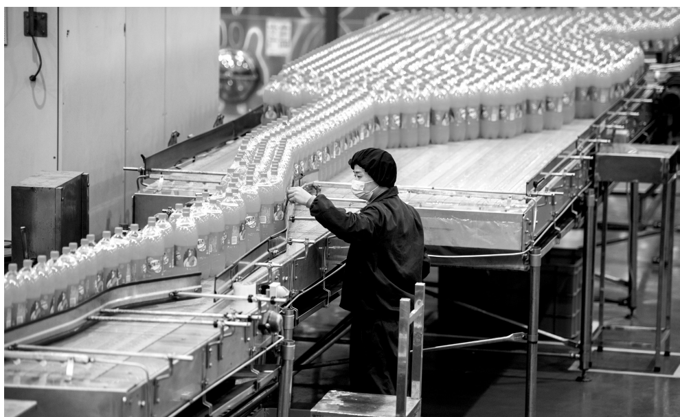
抓“管”也抓“产”，让农产品既要产得出、产得优，卖得出、卖得好

农产品生产周期长，质量安全涉及的环节和因素很多，确保农产品质量安全的基础依然较为薄弱。例如，散装农产品标签不规范、进销台账不规范不齐全比较普遍。从调研看，出产地和进市场的两个关键环节是农产品质量安全的短板弱项。为更好促进农产品出产地与进市场的有效衔接，实现农产品来源可溯、去向可追，2016年原农业部开始在部分省试点承诺达标合格证制度，2019年开始在全国试行。推进承诺达标合格证制度是党中央、国务院作出的决策部署，是顺应新形势新要求，加强农产品质量安全工作的重要制度创新。总结实践经验，新法规定农产品生产企业、农民专业合作社应当按规定开具承诺达标合格证；从事农产品收购的单