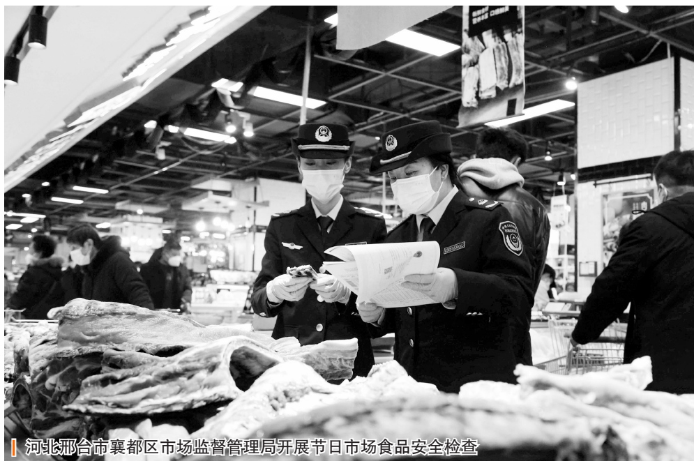
河北邢台市襄都区市场监督管理局开展节日市场食品安全检查

民以食为天，食以安为先。农产品的质量安全状况如何，直接关系到人民群众的身体健康乃至生命安全。习近平总书记在山东考察时指出，以满足吃得好吃得安全为导向，大力发展优质安全农产品。确保农产品质量安全，既是食品安全的重要内容 and 基础保障，也是建设现代农业的重要任务。为了将经实践证明行之有效的政策、措施法律化、制度化，进一步提高农产品质量安全水平，保障农产品质量安全，维护公众健康，促进农业农村经济发展，2006年我国出台了《中华人民共和国农产品质量安全法》，2018年对个别条款进行了修正。近些年，我国农产品质量安全整体态势总体