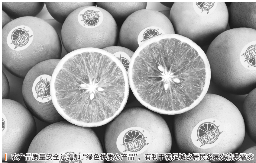
农产品质量安全法增加“绿色优质农产品”，有利于满足城乡居民多层次消费需求

关活动和国际标准研制动态，推动中国主张、中国技术和中国做法作为国际食品法典标准与规则。对照新法要求，进一步充实专家队伍，完善CAC专家联合联动工作机制，充分发挥CCPR、CCFA主席国及亚洲区域协调员身份作用，主动加强与FAO、WHO等国际组织的沟通联络并做好服务，强化与各个区域国家的