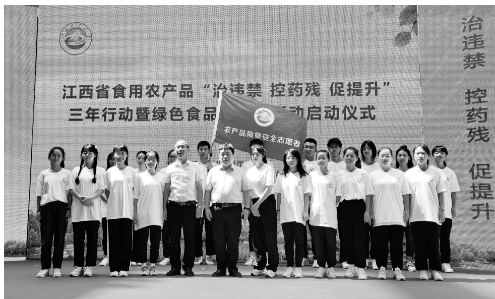
要抓好“治违禁 控药残 促提升”三年行动,巩固农产品质量安全稳定向好态势

确保农产品质量安全,必须压紧压实各方责任。新修订的农产品质量安全法,进一步明确了县级以