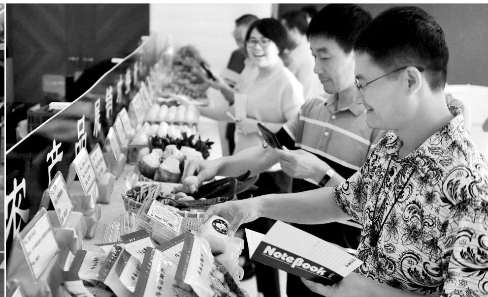
推进农产品关键信息展示公开，让消费者掌握更多信息来判断是否购买