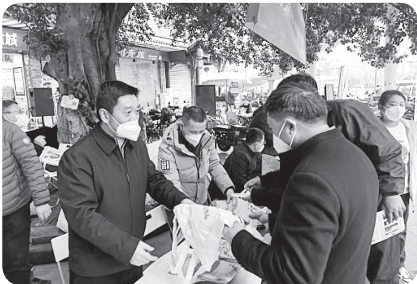
四川省成都市组织开展新修订农产品质量安全法宣贯活动