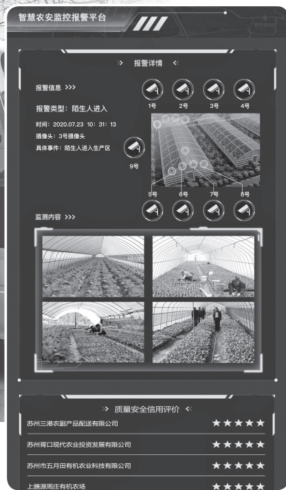
智慧农安监控报警平台

市场监管部门在本级政府统一领导下，共同努力将产地准出与市场准入相衔接，推动“从田头到餐桌”全链条监管，真正实现消费者吃得放心、吃得安心。