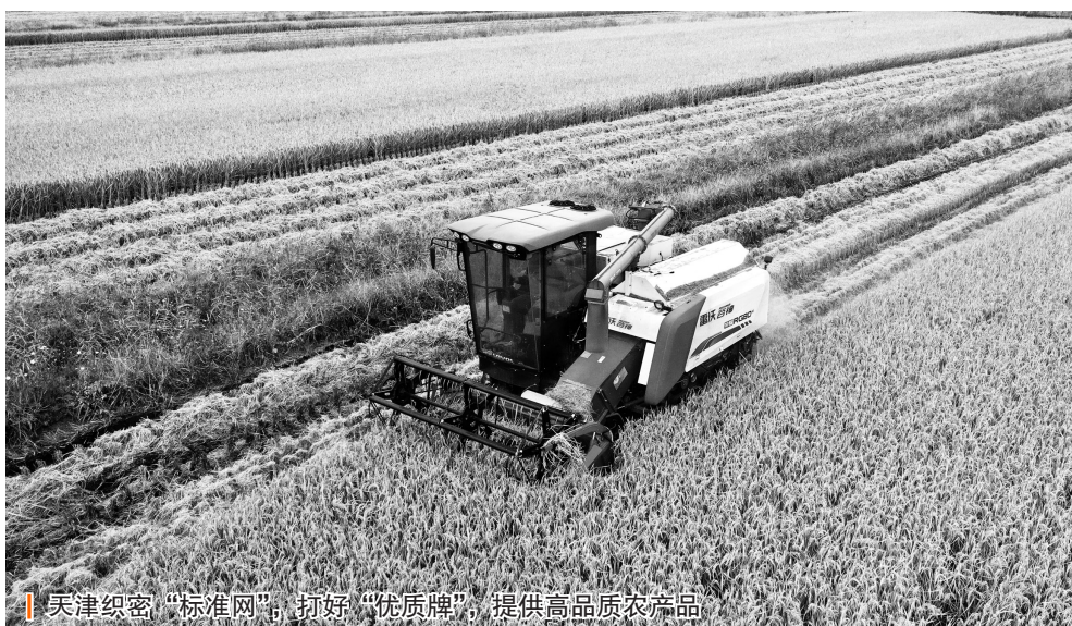
天津织密“标准网”，打好“优质牌”，提供高品质农产品

以考核为抓手，压实各涉农区人民政府属地责任。将农产品质量安全监管重点工作纳入市食品安全