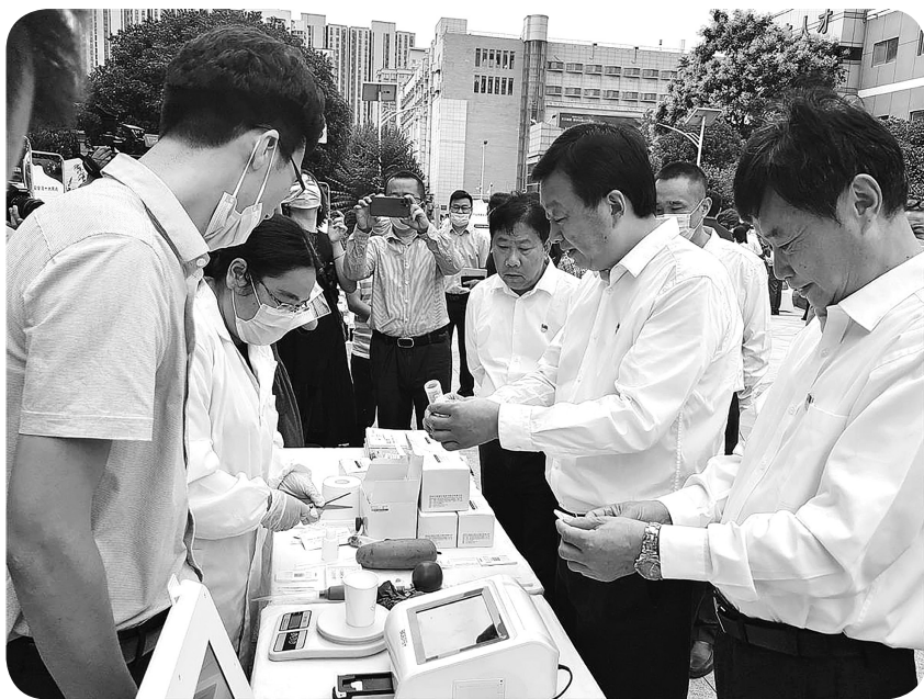
湖北省开展普法行动进社区活动

“确保农产品质量安全，是三农工作的底线目标，是涉农部门和企业的应尽之责，也是全社会的共同呼声。”湖北省农业农村厅党组书记、厅长吴祖云说，希望全省农产品生产经营主体视质量安全为企业发展的生命线，诚信经营、守法经营，确保农产品产出安全。广大人民群众要进一步提高质量安全意识，主动加强监督，构建全民参与、群防群控的农产品质量安全监管网络，共同书写湖北农产品质量安全的精彩答卷。🍎