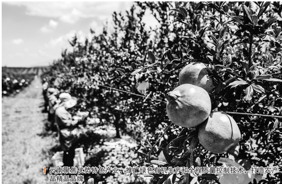
云南聚焦优势特色产业，推广绿色有机生产和全程质量控制技术，打造农产品精品品牌

以加大监测力度为途径，及时排查风险隐患。农产品质量安全监管工作必须坚持问题导向。省农业农村厅严格落实“大宗产品不放松，小宗产品不落空，重点品种持续监测，其他品种轮动监测”的工作要求，加大监测力度排查风险隐患，坚持“五个必抽”，即国家、省级农产品质量安全县必抽，“一县一业”示范县、特色县必抽，云南省“10大名品”必抽，省级以上龙头企业、农民专业合作社示范社、示范家庭农场必抽，2020年以来，国家、省级例行监测发现的问题主体必抽。充分发挥了农产品质量安全监测的“探头”效应，及时发现了重点品种和农产品生产、运输、销售等环节存在的风险隐患，为实施精准化监管奠定基础。强化监测结果运用，严厉查处农产品质量安全违法违规行为，主动向社会公布农产品质量安全典型案例和样品抽查不合格信息，有效震慑违法违规违法行为。2022年，全省各级农业农村部门完成定量检测任务81984