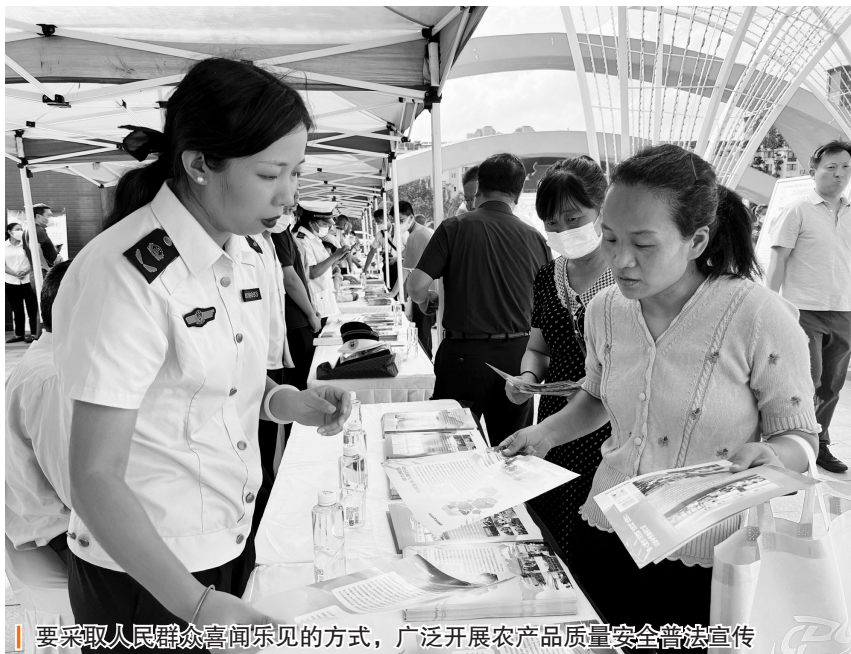
要采取人民群众喜闻乐见的方式，广泛开展农产品质量安全普法宣传

强化了与农药密切相关产品的管理。一是强化法律、法规未明确但与农产品质量安全密切相关的农业投入品监管。农产品生产经营者应当依照法律、行政法规和国家有关强制性标准开展活动，同时还应